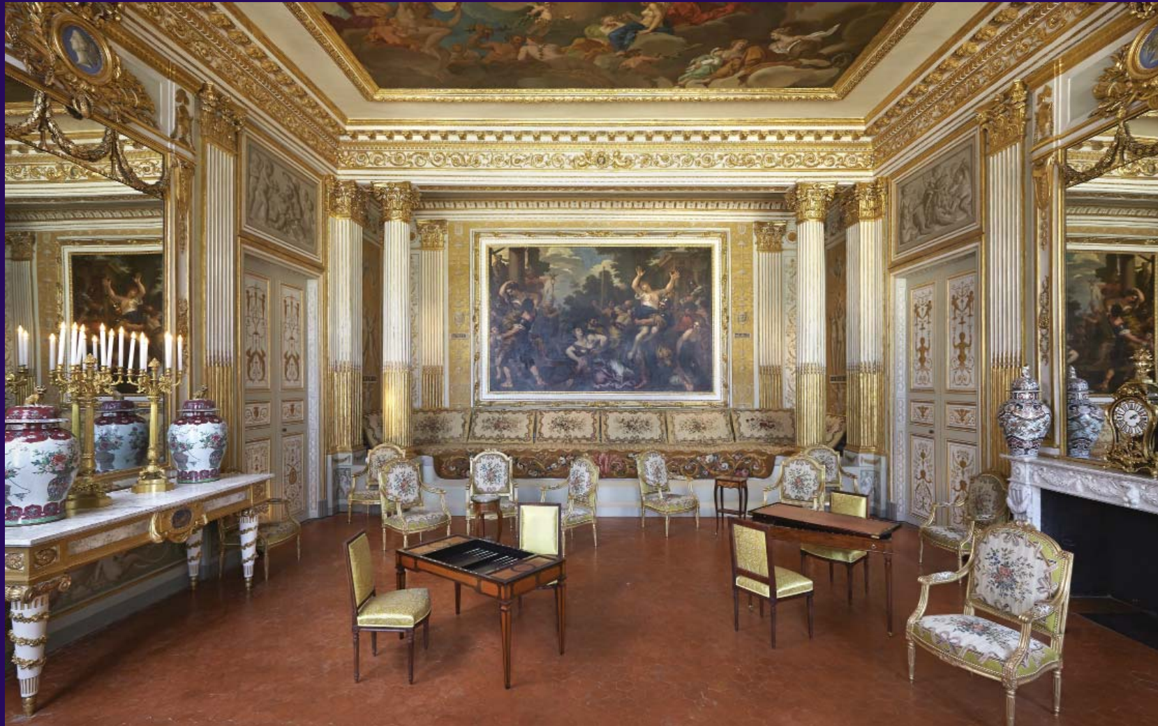
Salon doré du château de Borely

Auditorium de la galerie Colbert, Institut national du patrimoine